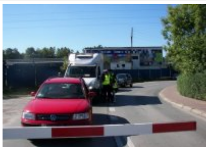
Policjanci w trakcie działań profilaktycznych